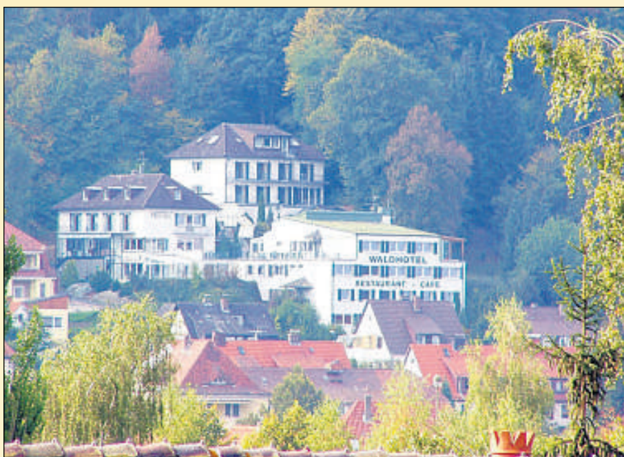
Die Seele baumeln lassen: Das Waldhotel Soodener Hof profitiert von einer einmalig schönen Umgebung mit ruhiger und erholsamer Atmosphäre und seinem atemberaubenden Blick in das Tal.

Kreative Köpfe – auch in der Küche – lassen sich so manch Neues einfallen, um den Gaumen der Gäste zu verwöhnen. Gerade in den kommenden Wochen darf man sich wieder auf besondere herbstliche und winterliche Menüs freuen. Die Arrangements im Waldhotel Soodener Hof bieten für jeden das Richtige. Jetzt im Herbst gibt es besondere Angebote mit viel Wellness- und Wohlfühlmomenten.