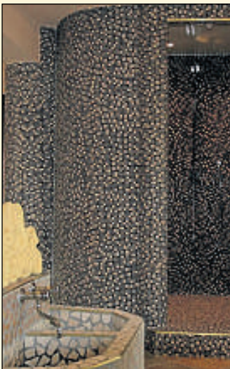
Mit allen Sinnen genießen: Das Beauty Spa Vita Nova verspricht Erholung pur. Dort kann man sich rundherum verwöhnen lassen.