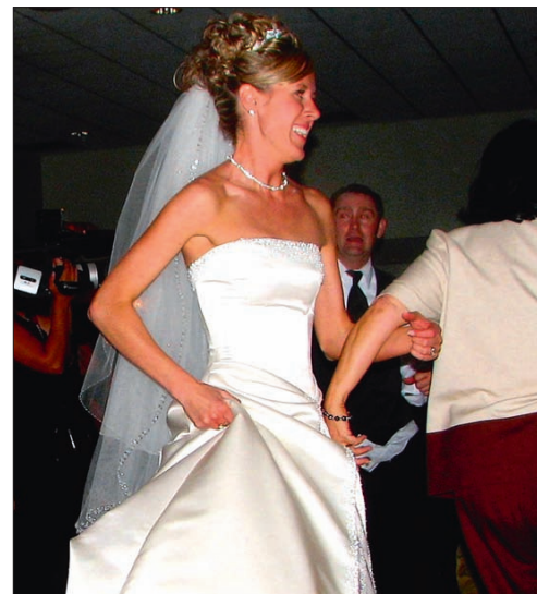
Der Brauttanz ist für viele Paare eine Herausforderung. Diese gut zu meistern, hilft ein Tanzkurs.

Hochzeitsplaner sind also meist „Mädchen für alles“ und Ansprechpartner nicht nur für das Brautpaar, sondern auch für die Gäste des Hochzeitstages.