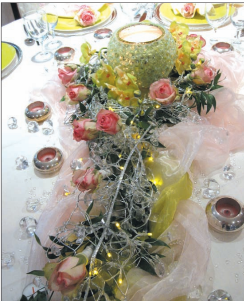
Tischdeko auf der Hochzeit verdient besondere Aufmerksamkeit.

Schön, wenn sich eine Deko-idee wie ein „roter Faden“