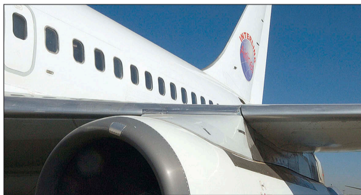
Flugangst kann durch spezielle Seminare überwunden werden.

angst ausbricht, ist das immer verbunden mit einer Veränderung der Atmung. Man versuche also als erstes seine Atmung zu kontrollieren. Grundlage aller entspannenden Atemtechniken ist die Bauchatmung. Ergänzen können Sie dies mit anderen Stressbewältigungs- und Spannungstechniken, wie z. B. autogenem Training. Ein verhaltenstherapeutisches Training oder ein Seminar kann man ebenfalls absolvieren. Hierfür gibt es unterschiedliche Verfahren.