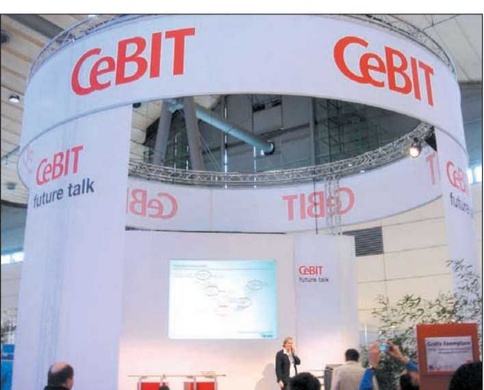
Geräte in den unterschiedlichen Preissegmenten, neue Services und Funktionen sowie Dienstleistungen stehen alljährlich im Mittelpunkt der CeBIT.

Weitere Neuerung: Der Datenfluss zwischen Prozessor und Arbeitsspeicher erfolgt nicht mehr über den sogenannten Memory-Controller auf dem Mainboard, sondern über den Prozessor – da dieser nun im Chip integriert ist. Bei Berechnungen sorgt das für mehr Datendurchsatz. Im Alltagsbetrieb ist der Geschwindigkeitszuwachs aber kaum spürbar.