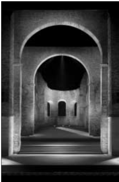
Stiftsruine Bad Hersfeld

Gehen Sie mit mir ein wenig zurück in der deutschen Geschichte, die in dieser Zeit bereits selbstverständlich eine europäische Geschichte war: