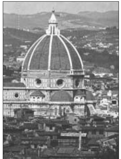
Dom zu Florenz

zweigung gipfelte schließlich darin, dass Konrad gemeinsam mit Welf von Bayern und den lombardischen Städten seinem Vater vier Jahre lang den Rückweg nach Deutschland versperrte. Im Mai 1098 wurde Konrad während eines Hoftages in Mainz auf Betreiben seines Vaters von den deutschen Fürsten als König abgesetzt. Auch im Bündnis mit der Markgräfin Mathilde kam es zu einer Krise. Politisch ohne Macht erlag Konrad in Florenz 27-jährig einer Krankheit.