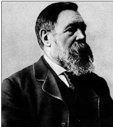
Friedrich Engels als alter Mann 1891

schierten. Die Genossinnen seiner Mary und Lizzie, die Arbeiterinnen der Industrie, für die er vor allem kämpfte. 1883 starb Marx und nun wurde es auch langsam etwas stiller um Friedrich. Er hatte immer drauflos gelebt und nie an seine Gesundheit gedacht, aber auch über den starken Mann und Kämpfer kamen einmal die natürlichen Beschwerden des Alters. Dann kam Krebs hinzu und schnell trat der Verfall ein. Am 5. August 1895, im 75. Jahre seines stürmischen Lebens,