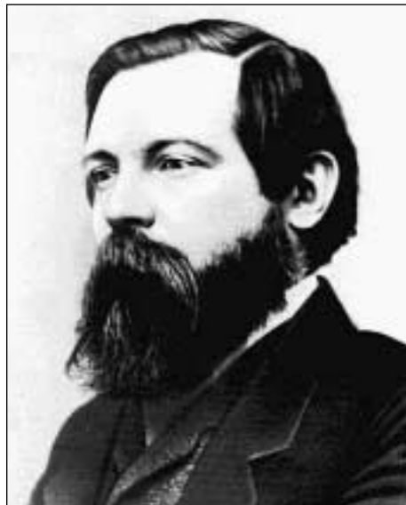
Friedrich Engels im mittleren Alter (um 1856)