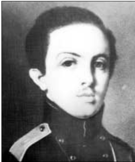
Friedrich Engels als Soldat

Volke, zu einer irischen Textilarbeiterin, und er gewann dadurch ein ständig zunehmendes Interesse für die Lage der arbeitenden Klasse. Nach diesem ersten kurzen Aufenthalt in England folgte die Soldatenzeit.